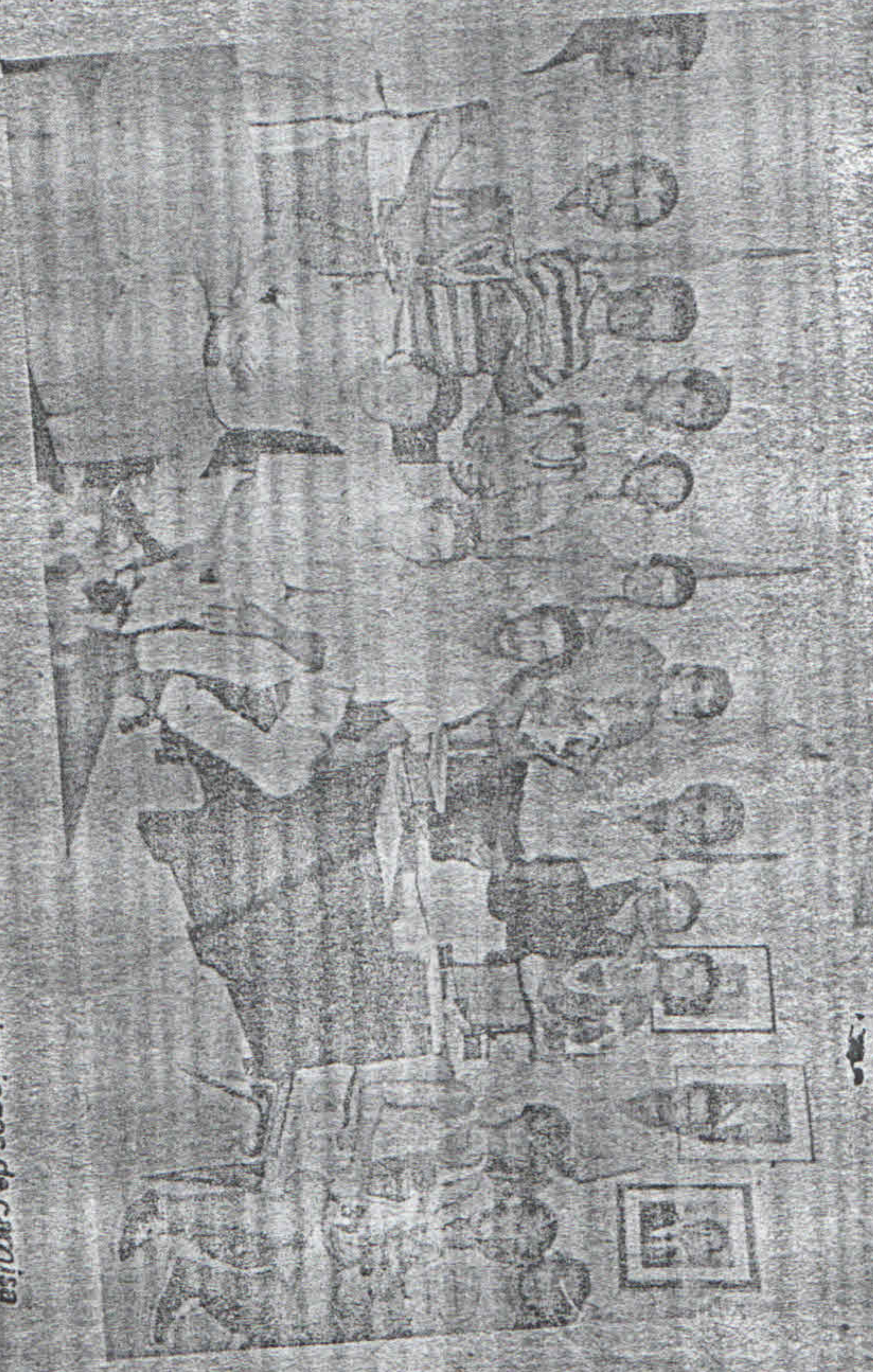
Representantes de equipes amadoras quando da entrega dos jogos de camisas