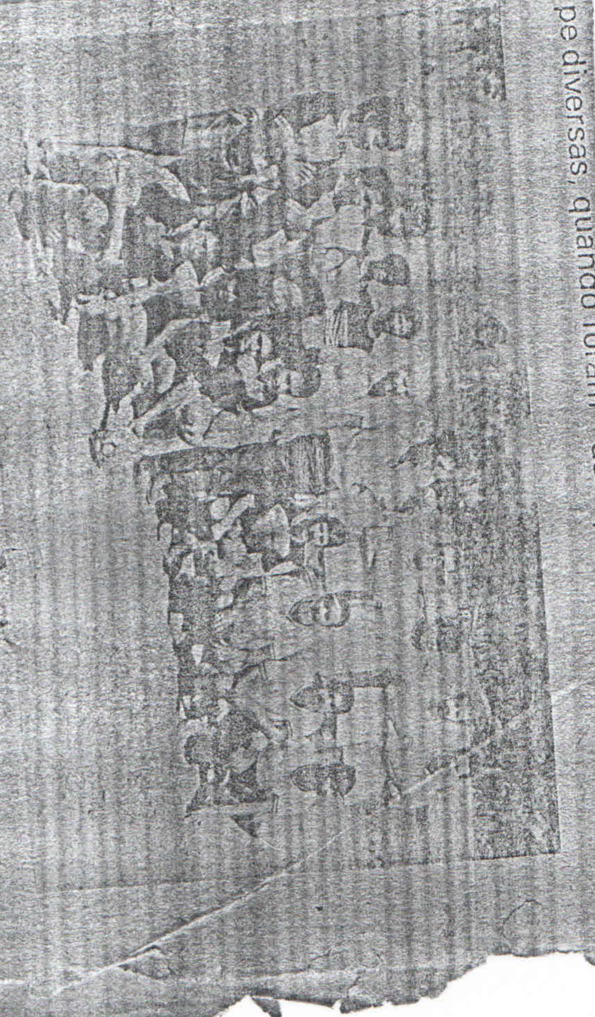
Paulo Sérgio com o "St. Pedro" e equipes esportivas

O campo de futebol society do bairro Jardim Piracema, inclusive, na